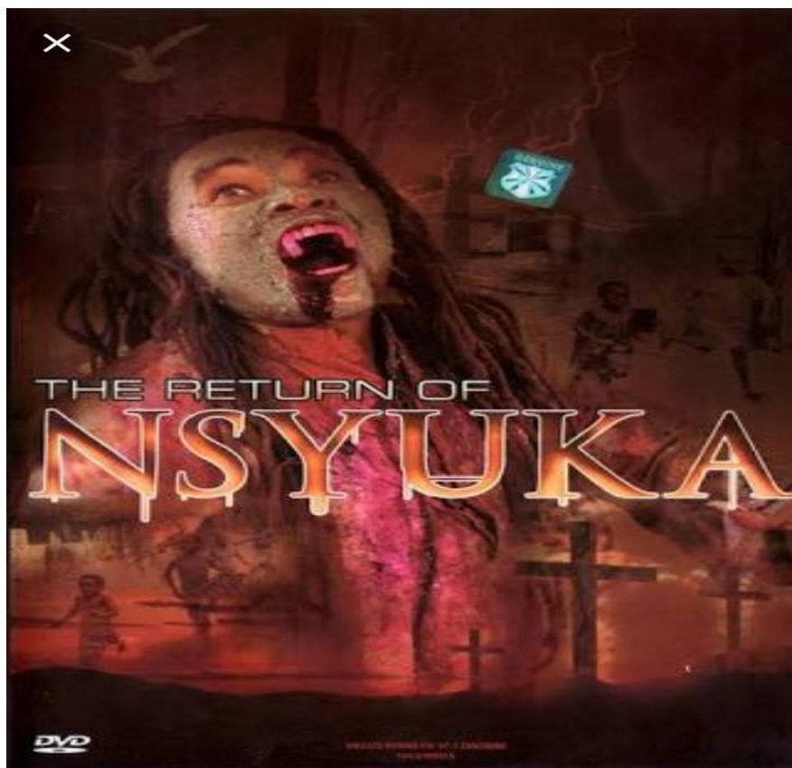
Picha Na. 2: Kasha la Filamu ya Nsyuka